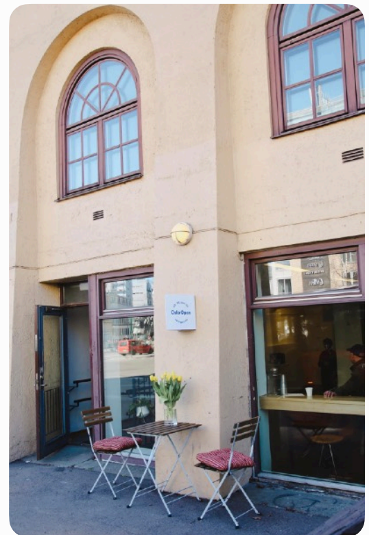
Oslo Opens pop-up kafé på Ila Pensjonat.

Om det er faglig vår i Oslo Open, er det dessverre økonomisk høst. Som flere kulturaktører merker vi konsekvensen av økte kostnader i samfunnet uten at tilskuddsnivå reflekterer dette. På slutten av året fikk vi ny treårig arrangørtilskudd fra Kulturdirektoratet etter vedtak hos Norsk Kulturråd. Vi takker ydmykt for fortsatt støtte og forutsigbarhet, samtidig vil støttebeløpet på 700.000 kr. ved utgangen av ny treårsperiode ha stått stille i seks år. Det betyr en kraftig prosentvis nedgang i kroneverdi. Styret mener at vår vertskommune Oslo nå må komme på banen for å sikre utviklingen i et gratis tilbud for byens innbyggere som gir tusenvis av besøkende et helt unikt innblikk i hvordan kunst skapes. Oslo Open er et viktig arrangement i Oslos kulturliv, som skaper ringvirkninger for kunstnere og kunstinstitusjonene, styrker nettverkene i det